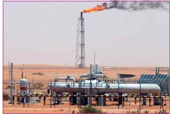
그림 3. 알제리 천연가스 생산현장