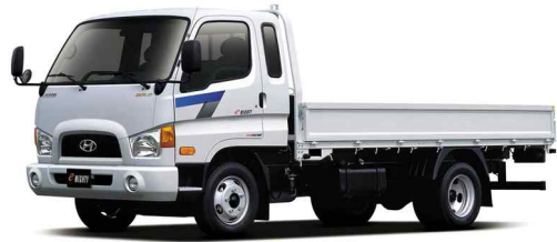
그림 6. 현대자동차가 알제리에 조립 생산할 경트럭 (마이티)