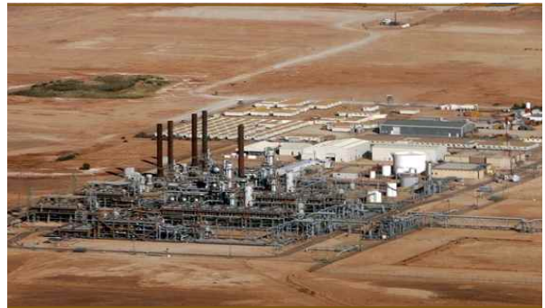
그림 5. 원유 생산현장