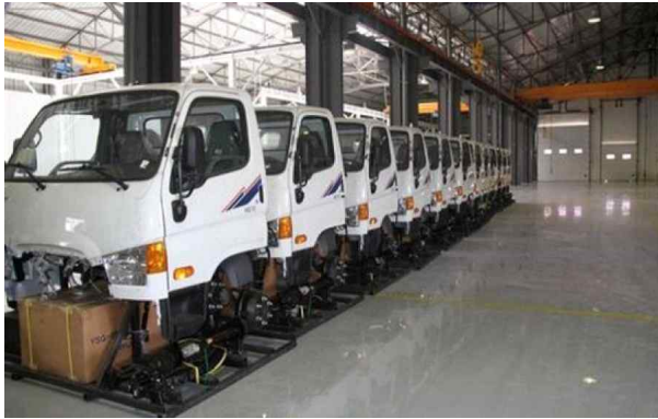
그림 5. 현대자동차 알제리 현지공장